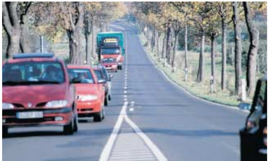
Wer dem Stau ausweichen möchte, braucht gute Karten.

Wichtig für eine Auslandsreise sind Pass oder Personalausweis, unter Umständen ein Visum, die Grüne Versicherungskarte, Versicherungen für